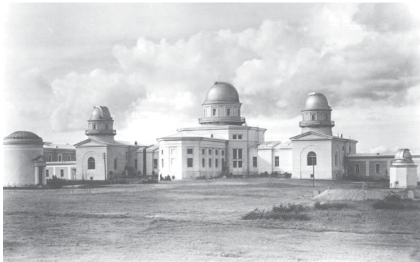
Южный фасад Главного здания. 1953 г.

К тому времени в Пулковке уже осуществили значительную часть подготовительных работ. Были возведены временные жилые постройки, транспортные сооружения, проведена линия электропередач, железнодорожный тупик и др. Пулковцы все еще жили и работали в Ленинграде, но стремились поскорее начать наблюдения в сво-