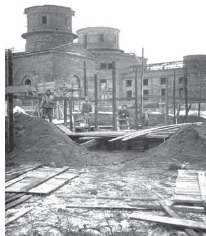
Вид на Главное здание в период восстановления

Обследование Пулкова явилось мерой по выполнению распоряжения правительства от 19 мая 1944 года о восстановлении ГАО и ее отделений 11 . Принятие решений на государственном уровне можно обозначить как второй этап воз-