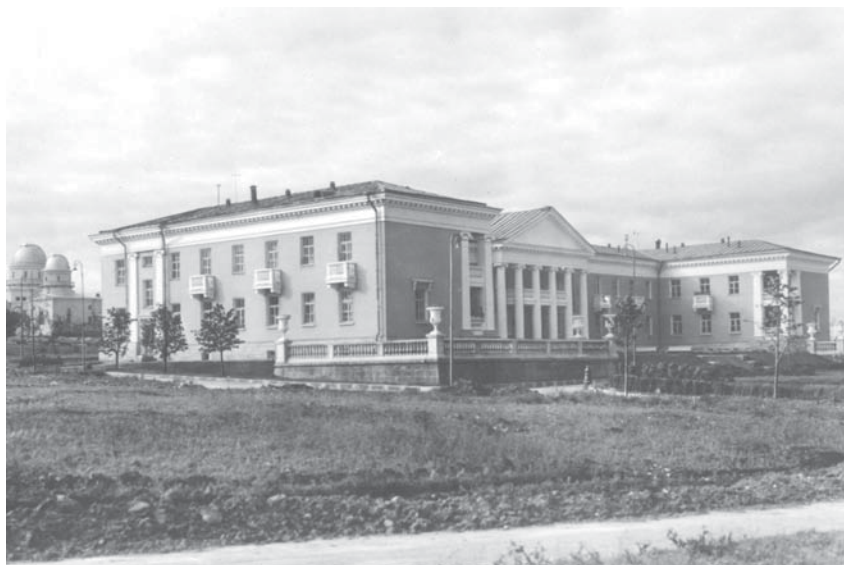
Гостиница. 1953 г. Из альбома о восстановлении обсерватории