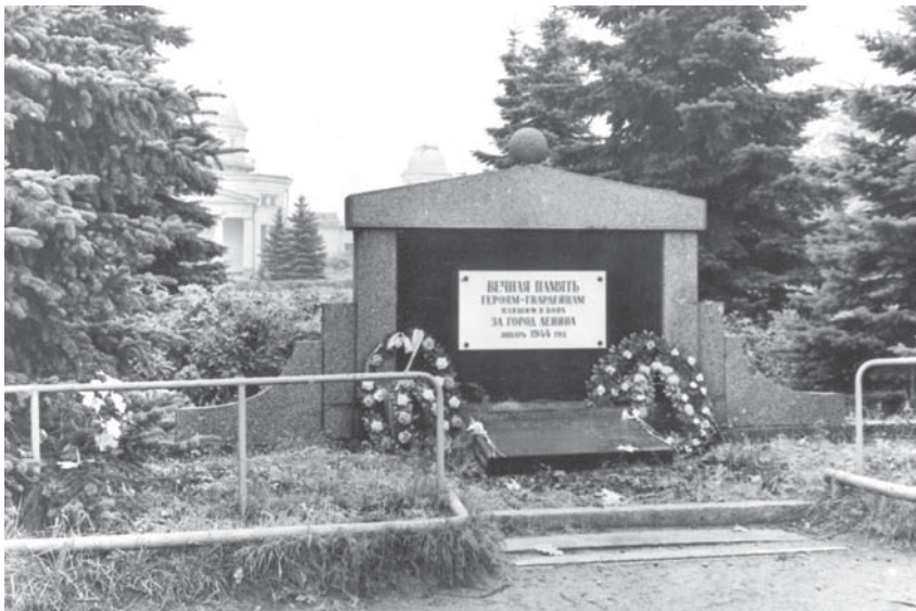
Стела на верхнем братском захоронении.