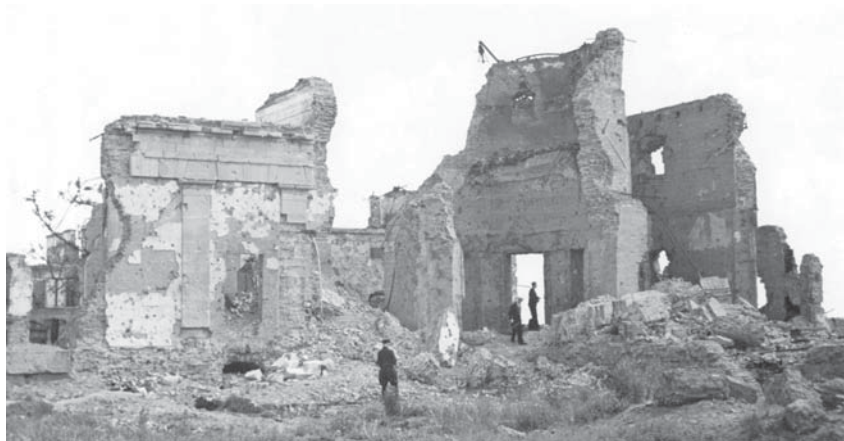
Руины центральной части Главного здания. 1944 г.