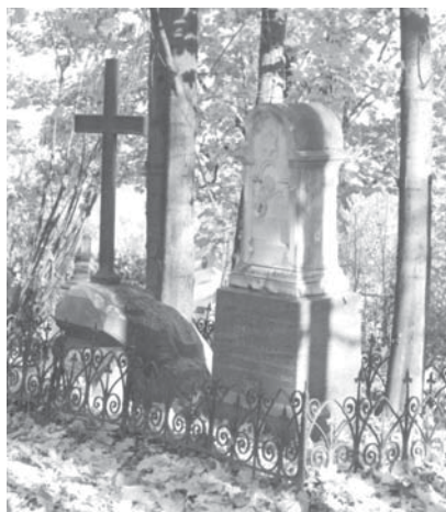
Надгробия основателя Пулковской обсерватории В. Я. Струве (с крестом) и его жены на Пулковском мемориальном кладбище астрономов.

Так приветствовали Пулковскую обсерваторию научные учреждения в мае 1954 года, когда она