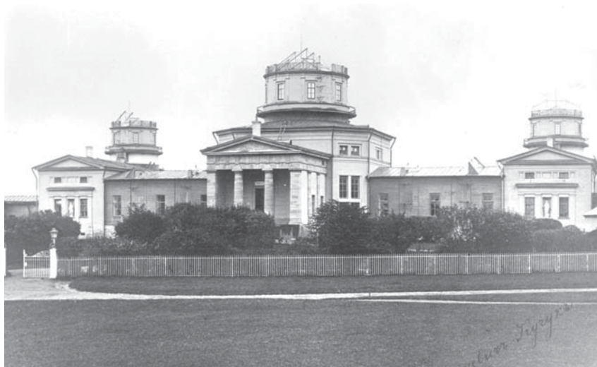
Пулковская обсерватория до войны

имела обширный горизонт. Кроме того, Пулково было окружено заливными лугами, что способствовало отсутствию пыли и туманов, а значит, прозрачность, столь необходимая для наблюдений, была здесь обеспечена. Кроме того, В. Я. Струве считал, что удаленность Пулково от столицы (17 верст) «полезна для астрономов, мешая им развлекаться» 2 . С первых лет своего существования Пулковская обсерватория стала играть ведущую роль в астрономии и снискала славу «астрономической столицы мира». Благодаря стараниям В. Я. Струве обсерватория была оснащена новейшими для того времени инструментами, а библиотека являлась лучшим собранием астрономической литературы.