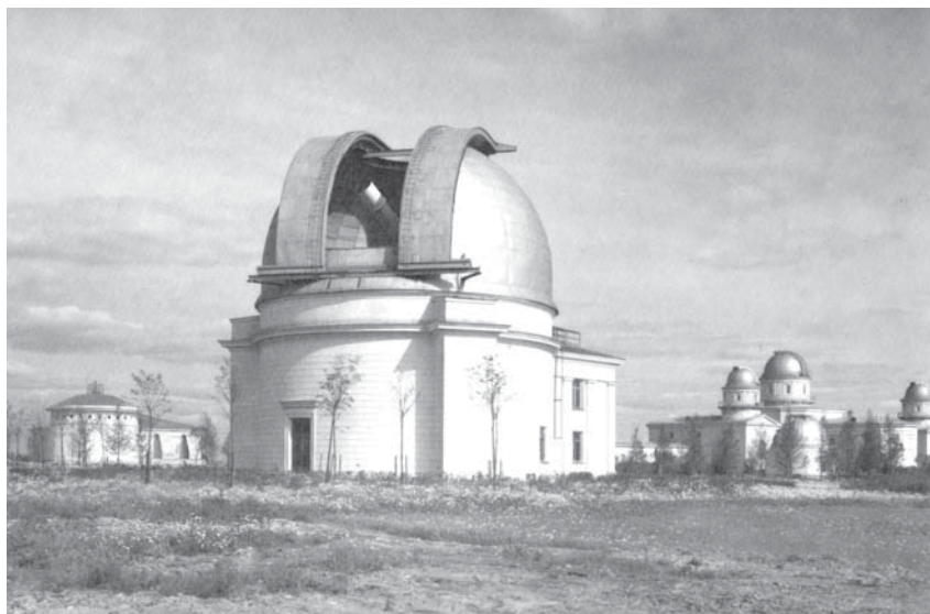
Башня 26-дюймового рефрактора. Слева – здание астрофизической лаборатории, справа – Главное здание. 1953 г. Фото А. А. Михайлова

Наблюдения проводились не только в Пулковке и на Горной станции. Астрономы-солнечники старались не пропускать такие события, как солнечные затмения. Три подобных явления совпали с поворотными моментами