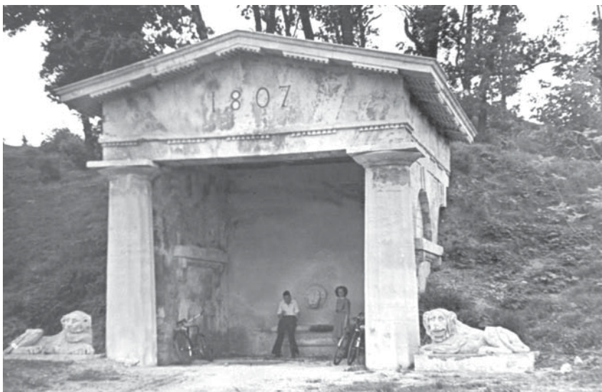
Грот-фонтан «Старик». Арх. А. Н. Воронихин. Фото 1950-х гг.

Не все замыслы архитекторов осуществились. Не удалось создать мемориал на кладбище астрономов. Только в проектах остались парковый павильон со спортпомещениями, беседка на острове пруда и другие сооружения малых форм.